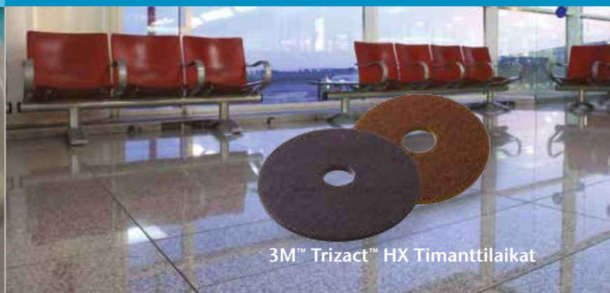
3M™ Trizact™ HX Timanttilaikat