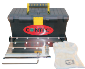
Varustepakki sisältyy BULLin toimitukseen

Contec matonpoistokoneet MULE B ja BULL 2 poistavat useita eri lattiapäällysteitä, kuten kokolatiamattoja, jalopuuta, parkettia sekä erilaisia pinnotteita että keraamisia laattoja. Molemmat matonpoistokoneet on varustettu erillisellä ajomoottorilla sekä korkeussäädettävillä, vaimennetuilla käsikahvoilla.